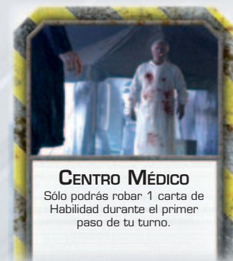
Una de las localizaciones de riesgo del tablero

Las localizaciones rodeadas por un borde metalizado con franjas amarillas se consideran zonas de alto riesgo: son la “Prisión”, la “Enfermería”, la “Nave Resurrección”, el “Centro Médico” y el “Centro de Detención”. Ningún jugador puede entrar voluntariamente en ellas como parte de su movimiento normal. Sólo se puede entrar en una localización de riesgo como resultado del efecto de una carta o regla de juego.