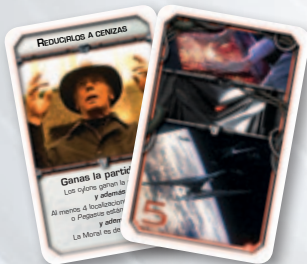
Cartas de Estrategia hostil

Hay dos tipos de cartas de Estrategia para los líderes cylonos: hostiles y solidarias. Estas cartas les plantean objetivos específicos que deben cumplir para ganar la partida. El número de jugadores determina el mazo del que habrán de robar estas cartas los líderes cylonos (para más información, consulta las reglas de los líderes cylonos en la página 10).