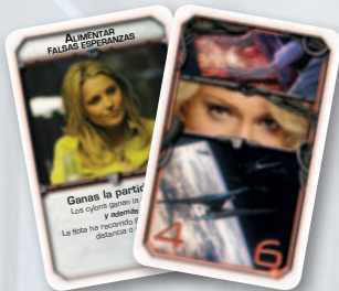
Cartas de Estrategia solidaria